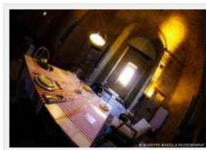
A casa Castiglioni

Al Castello della Zisa la mostra "A casa Castiglioni" ospita gli oggetti di uso quotidiano creati dal famoso designer Achille Castiglioni.