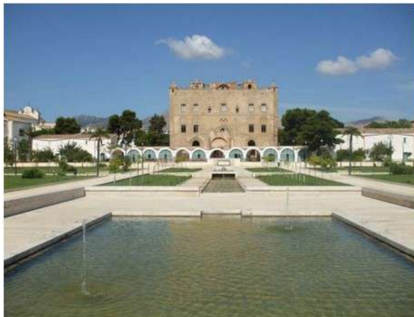
Palermo, Il Castello della Zisa

L'evento, a cura della Fondazione Achille Castiglioni , avrà luogo presso il Castello della Zisa a Palermo e dal mese di novembre sarà ospitata a Milano negli spazi della Fondazione.