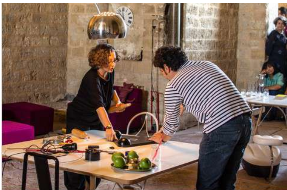
↑ "A casa Castiglioni", Castello della Zisa, Palermo

In mostra gli oggetti ideati per la vita quotidiana, inseriti nel loro reale contesto di utilizzo. Lo spazio, allestito come un vero e proprio alloggio abitativo, viene vissuto più che contemplato, perché ogni oggetto ha un posto preciso, progettato per quella specifica funzione.