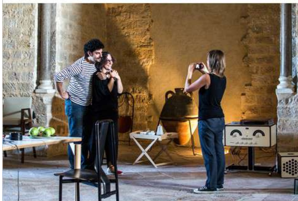
↑ "A casa Castiglioni", Castello della Zisa, Palermo

Nell'ambito della seconda edizione della manifestazione "I-design", presso il Castello della Zisa, il 20 ottobre è stata inaugurata "A casa Castiglioni", mostra itinerante dedicata al grande architetto e designer.